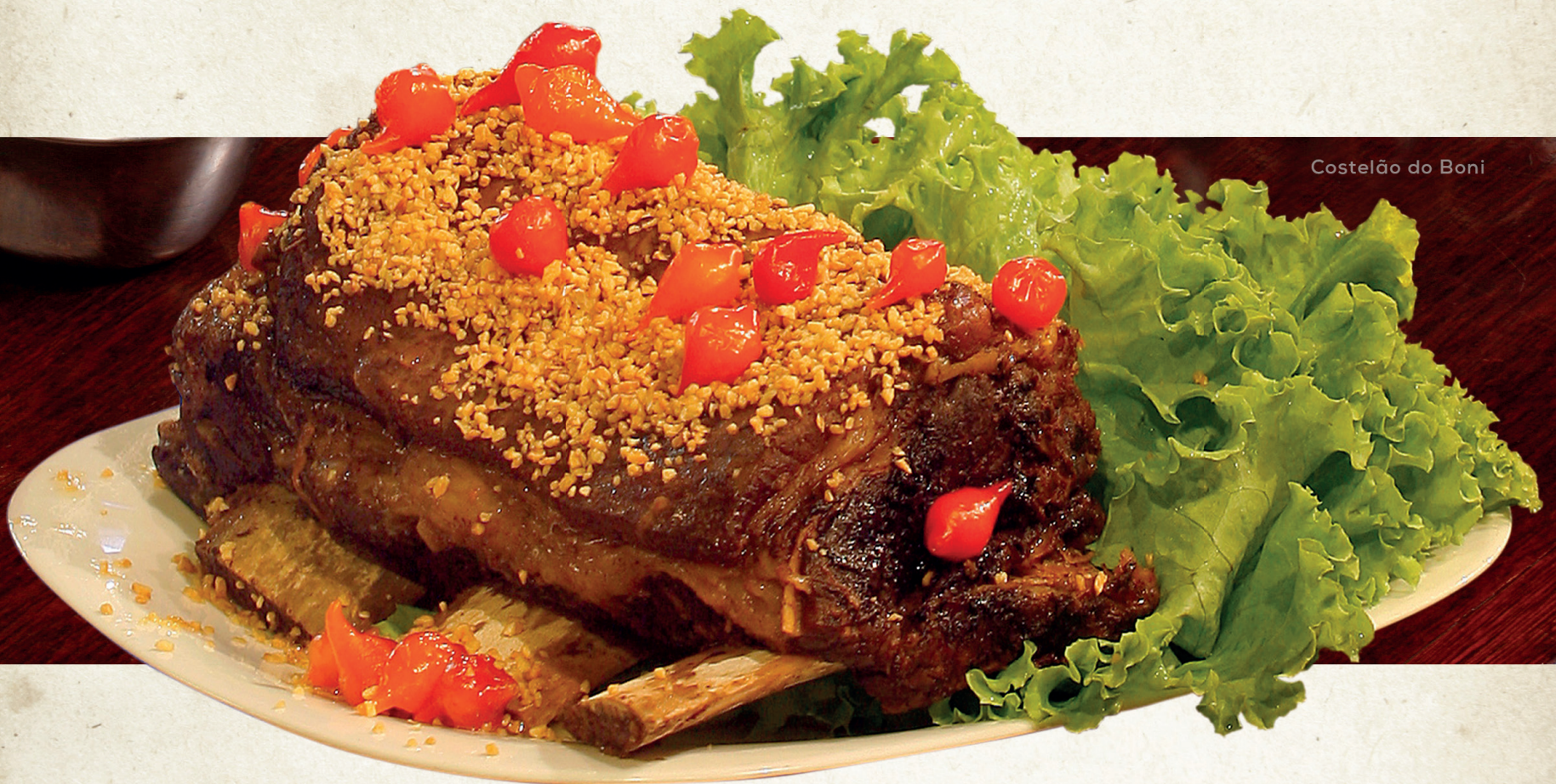
Costelão do Boni

(Acompanha arroz branco, feijão de corda e purê de mandioquinha)