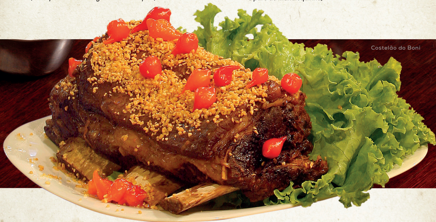
Costelão do Boni

Carne seca desfiada, puxada na manteiga da terra, com cebolas. (Acompanha arroz branco, feijão de corda e purê de mandioquinha)